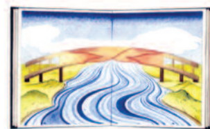
Un ponte sul fiume Guai Maggioli Editore