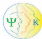
L'intervento psicologico in Oncologia: dai modelli di riferimento alla relazione con il paziente Carocci Faber Editore